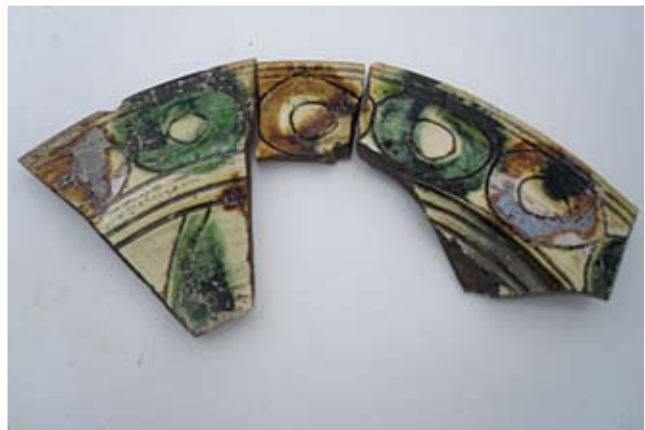
Τμήμα εφωλωμένου πινακίου