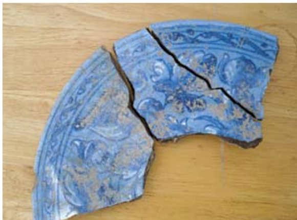
Τμήμα εισηγμένου μαγιόλικου πινακίου

Το ύψος διάσωσης των τοίχων είναι αισθητά χαμηλότερο από τα κατάλοιπα της νότιας πτέρυγας της οικοδομής. Κυμαίνονται από μηδενικό ύψος μέχρι και 80 εκ. Τούτο οφείλεται αφενός στην ανοδική πορεία του φυσικού βράχου προς τα βόρεια και κατά συνέπεια στη μικρή επίχωση, καθώς και στην εκτενέστερη λιθολόγηση του μνημείου, που έλαβε χώρα στα νεώτερα χρόνια. Οι εξωτερικοί τοίχοι του κτίσματος έχουν κυμαινόμενο πάχος γύρω στα 65