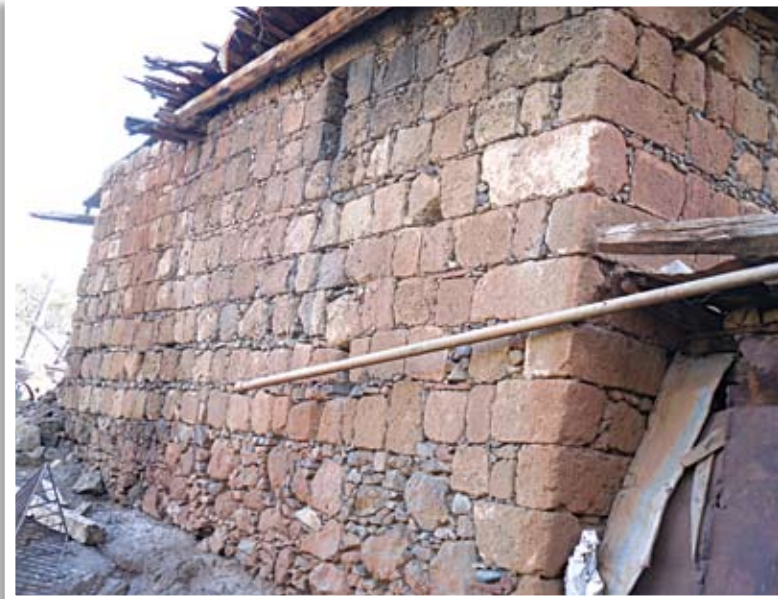
Οικία Κάβουρα στον Πάνω Πύργο Τηλλυρίας δομημένη σχεδόν εξολοκλήρου από ορθογωνισμένους πωρόλιθους οι οποίοι αφαιρέθηκαν από τα ερείπια της τοποθεσίας Αυλή

Η φετινή ανασκαφή επικεντρώθηκε προς τα βόρεια των οικοδομικών καταλοίπων, που εντοπίστηκαν κατά την περσινή πρώτη ανασκαφική φάση. Όπως αναμενόταν, το οικοδόμημα που ήταν κτισμένο με ορθογωνισμένους πωρόλιθους σε ισοδομικό σύστημα, επεκτεινόταν προς βορρά. Πρόκειται για την ανατολική πτέρυγα της οικοδομής, διαστάσεων περίπου 38 X 6.30 μέτρα και με άξονα νότος – βορράς, η οποία πιστεύεται ότι ήταν το σημαντικότερο τμήμα του όλου συγκροτήματος. Σύμφωνα με τα ανασκαφικά δεδομένα αυτή αποτελείται από έξι δωμάτια ανισομερή μεταξύ τους. Οι διαστάσεις τους ποικίλλουν ως προς το μήκος από 5.50, 6.60, 6.90 μέτρα. Ιδιαίτερα μεγάλη είναι η αίθουσα 6 με διαστάσεις 9.70 X 5.30 μέτρα. Η θεμελίωση και της πτέρυγας αυτής έγινε απ' ευθείας πάνω στον φυσικό ηφαιστειογενή βράχο της περι-